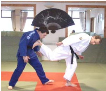
UCHIRO GERI : Coup de pied arrière