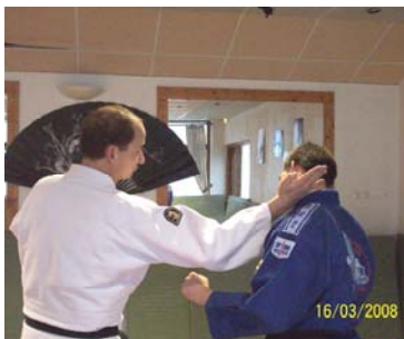
SHUTO : Coup donné avec le tranchant de la main