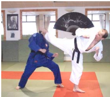
URA MAWASHI GERI : Coup de pied circulaire arrière