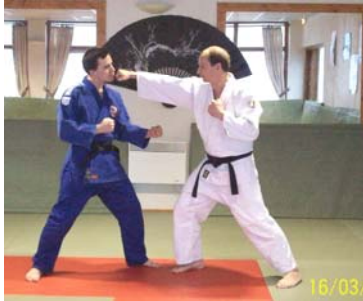
OI TSUKI : Coup de poing direct