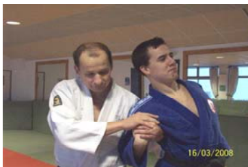
TE KUBI OSAE : Clé de poignet en couvrant la main