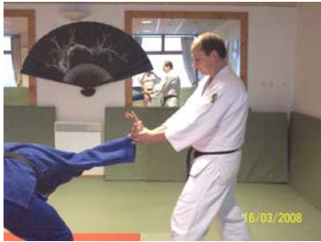
KOTE MAWASHI : Clé de poignet circulaire