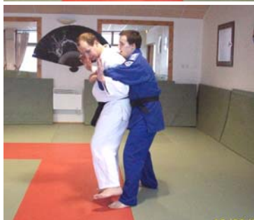
KAKATO GERI : Coup de pied frappé avec le talon