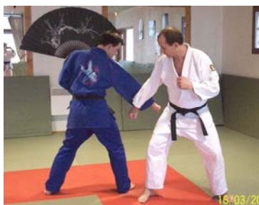
GEDAN BARAI : Blocage bas