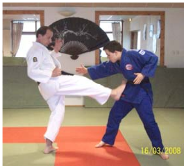
MAE GERI : Coup de pied direct

Ce sont les coups frappés par les membres supérieurs, inférieurs ou la tête.