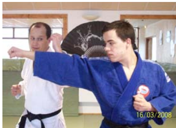
SOTO UKE : Blocage avec l'avant bras de l'extérieur vers l'intérieur