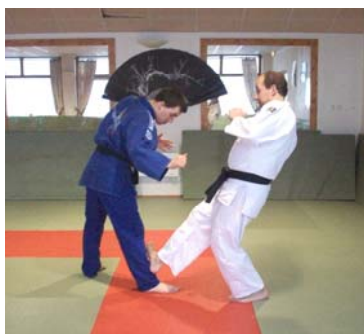
GEDAN GERI : Coup de pied bas