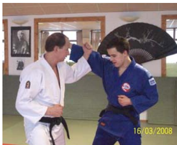
UCHI UKE : Blocage avec l'avant bras de l'intérieur vers l'extérieur