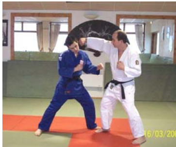
NANAME TSUKI : Coup de poing circulaire