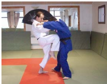
HIZA GERI : Coup de genou