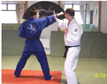
SHUTO UKE : Blocage avec le tranchant de la main