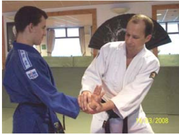
KOTE MAWASHI : Clé de poignet vers L'intérieur