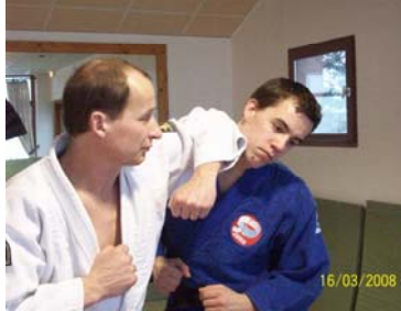
HIGI : Coup de coude