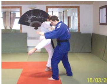
MAWASHI HIZA : Coup de genou circulaire