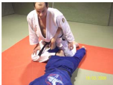
ASHI GARAMI : Clé de jambe par compression