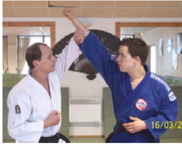
JODAN AGE UKE : Blocage en remontant