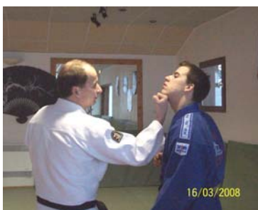
TSUKI AGE : Coup de poing remontant