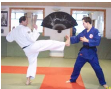
MIKAZUKI GERI : Coup de pied latéral