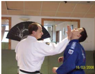
TEISHO : Coup donné avec la paume de la main