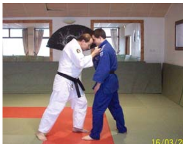
ATAMA : Coup de tête