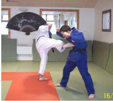
MAWASHI GERI : Coup de pied circulaire